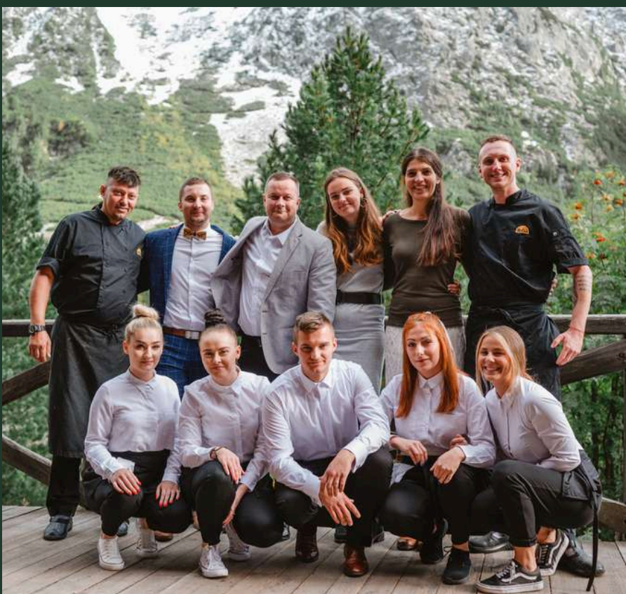
Tím PEKYHO Horský Hotel Popradské Pleso